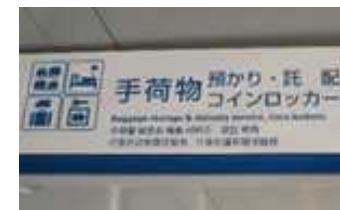
手ぶら観光カウンターの場所を案内する看板