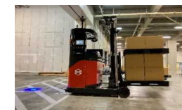
無人フォークリフト