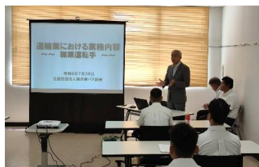
自衛隊駐屯地での就職説明会