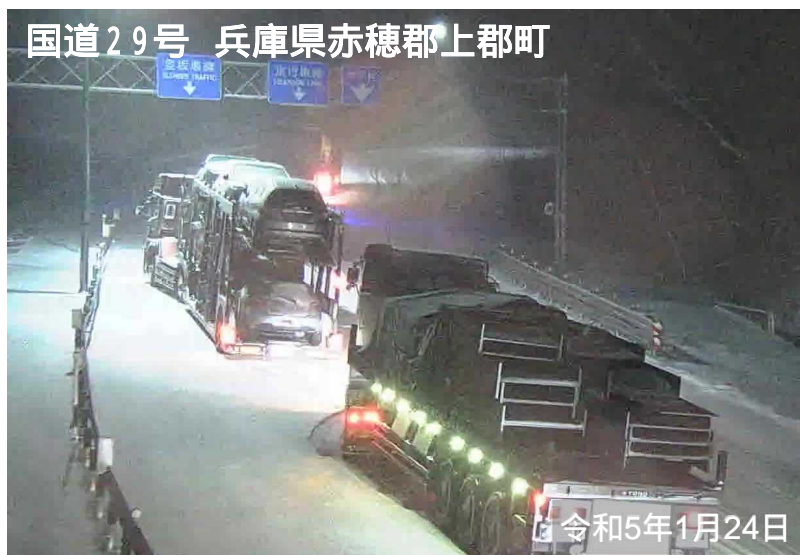
国道29号 兵庫県赤穂郡上郡町