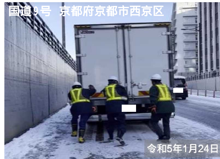
国道9号 京都府京都市西京区