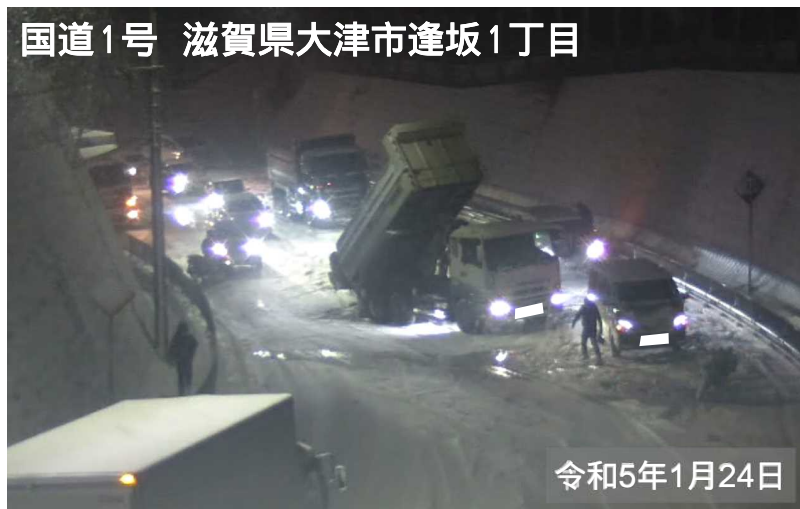
国道1号 滋賀県大津市逢坂1丁目