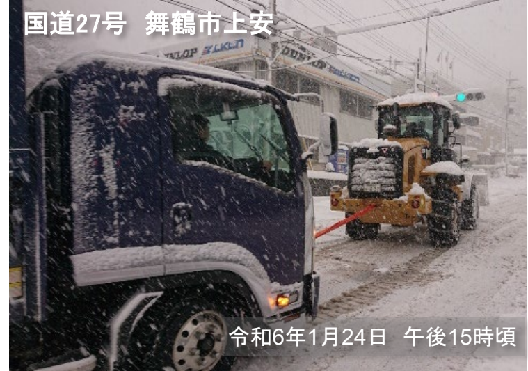
国道27号 舞鶴市上安