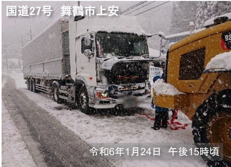
国道27号 舞鶴市上安