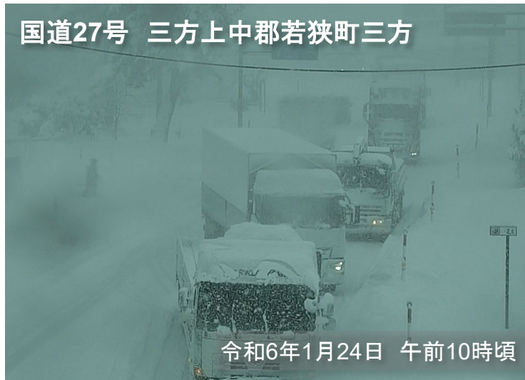
国道27号 三方上中郡若狭町三方