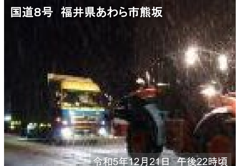
国道8号 福井県あわら市熊坂