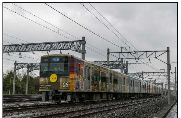
デザイントレイン（LEGOLAND®Train）