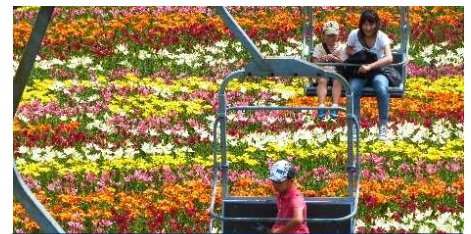
ダイナランドスキー場(ゆり園)