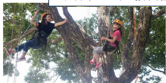
ひるがの高原スキー場(ツリークライミング)