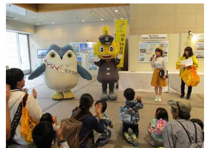
金山第二会場風景 (ゆるキャラと遊ぼうコーナー)