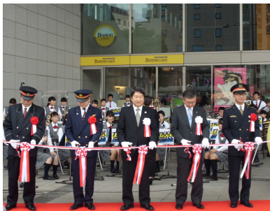
テープカット風景