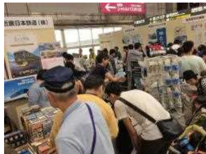
金山第一会場風景