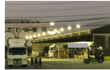
トラックターミナル