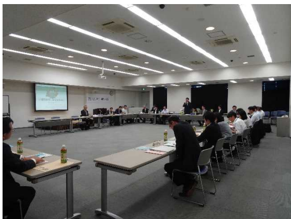
岡山県会議の様子

県単位のバリアフリー等地域連絡会議は、平成22年度の島根県会議を皮切りに、岡山県、山口県、広島県（鳥取県については鳥取県福祉のまちづくり推進協議会に鳥取運輸支局が参加）と立ち上げ、令和元年度は、岡山県と山口県において開催しました。それぞれの会議では、構成員からのバリアフリーに関する取組状況の紹介と各県のバリアフリーリーダーの承認、意見交換が行われました。