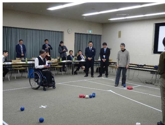
山口県会議の様子（ボッチャ体験）

会議で出された様々な意見については、構成員の共通認識として共有され、各施設設置者等の今後の参考となるものとなりました。また、今年度の山口県会議では、東京オリンピック・パラリンピック競技大会開催を来年度に控え、パラリンピックについてさらに理解を深めていただくため、構成員の方に競技種目「ボッチャ」を体験していただきました。