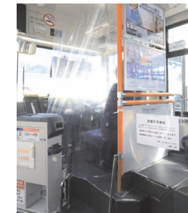
バス運転席仕切りカーテン