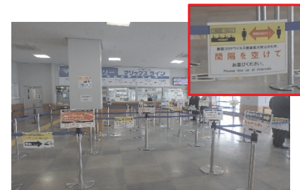
ターミナル等の衛生対策