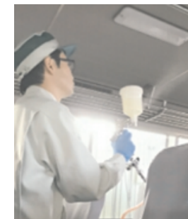
車内の抗菌・抗ウイルス対策