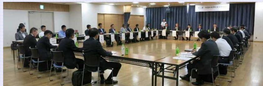
利用者の声を聞き、物流の更なる効率化を目指します