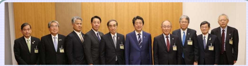
中国地方国際物流戦略チーム有志一同による政府への要望活動状況(R1.11.27)