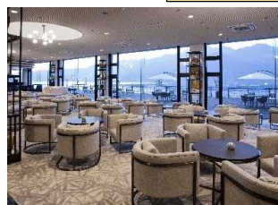
ラウンジ「シーガル」