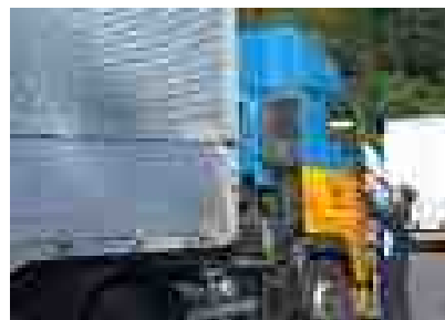
キャンペーン実施の様子