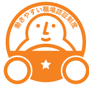
「一つ星」認証マーク

申請受付・認証業務は、国土交通省から、本制度の実施団体に選定された「一般財団法人日本海事協会（通称：ClassNK）」が行います。