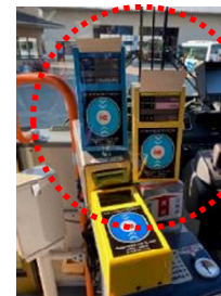
←実機のサイズ、色合を忠実に再現した手作りIC車載器