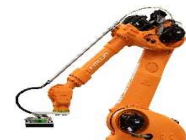
ピッキングロボット