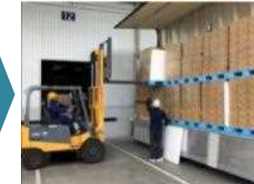
パレットの利用による荷役時間の短縮