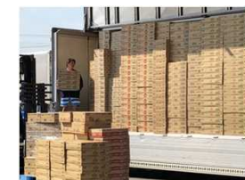
バラ積み・バラ降ろしによる非効率な荷役作業

※鉄道建設・運輸機構の業務に、認定「物流総合効率化事業」の実施に必要な資金の出資を追加。〈予算〉