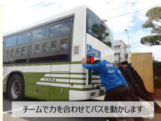
チームで力を合わせてバスを動かします