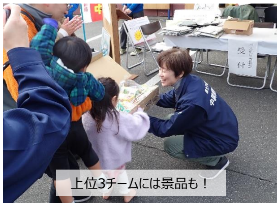
上位3チームには景品も！