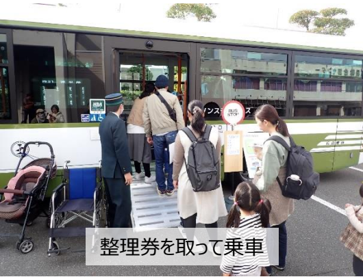
整理券を取って乗車

子どもたちを対象に、バスに乗る手順や、乗ってから降りるまでの注意事項について、各バス会社が交代でレクチャーしました。