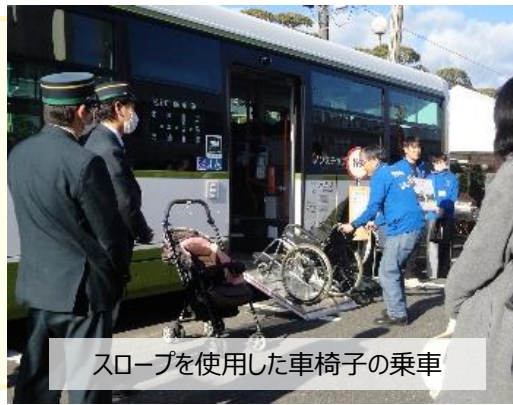
スロープを使用した車椅子の乗車