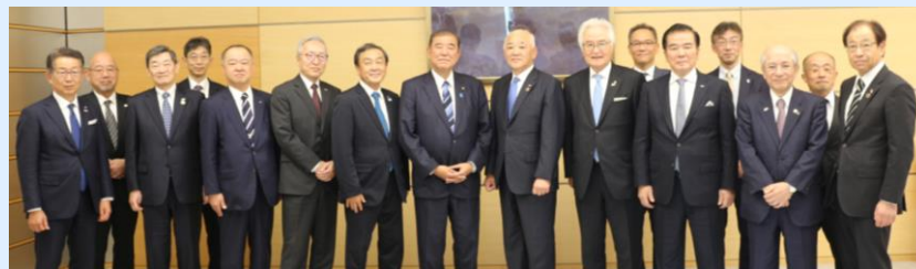
中国地方国際物流戦略チーム有志一同による政府への要望活動状況(R6.11.27)