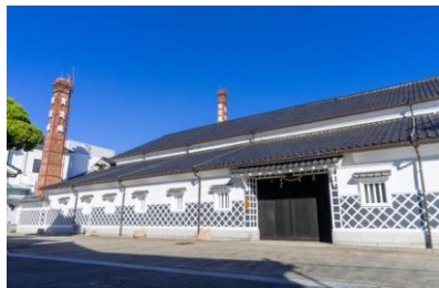
西条の酒蔵(日本酒)