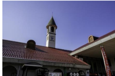
三次ワイナリー