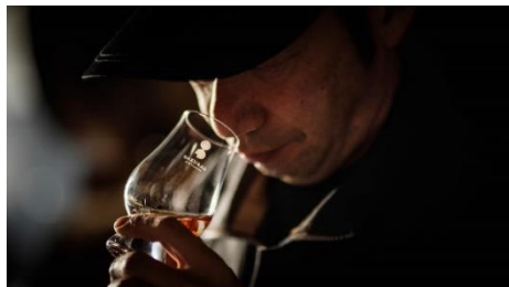
サクラオブルワリーアンドディスティラリー