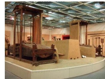
和鋼博物館