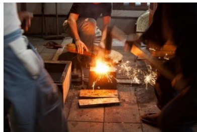
日本刀鑑賞。刀の制作過程見学