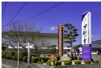
備前長船刀剣博物館