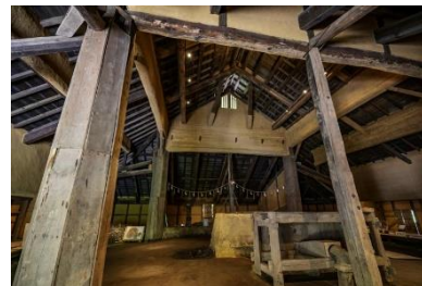
奥出雲たたらと刀剣館