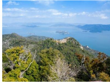
弥山パノラマ