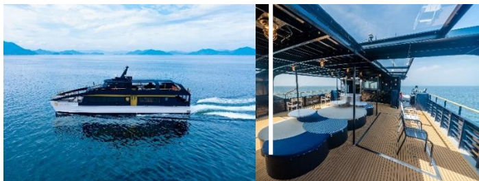
SEA SPICAで瀬戸内クルーズ