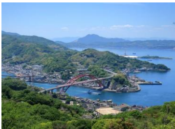
音戸の瀬戸