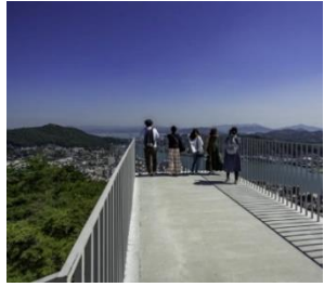
千光寺公園展望台から瀬戸内を望む