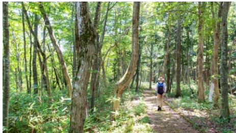
大山ブナの森ウォーク