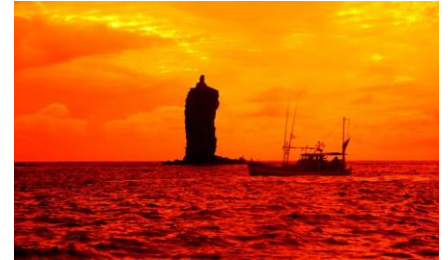
ローソク島遊覧船