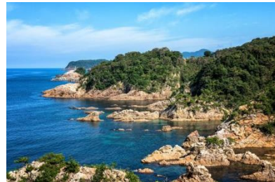
浦富海岸