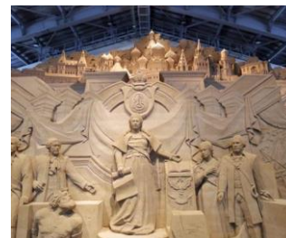
砂の美術館鑑賞