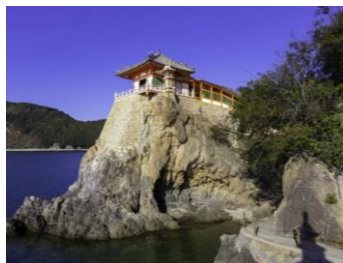
阿伏兎観音