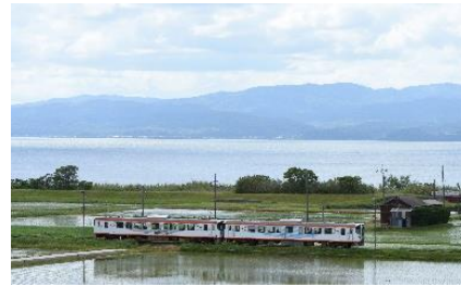
一畑電車