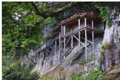
三徳山「国宝・投入堂」