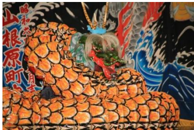
安芸高田神楽鑑賞