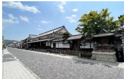
矢掛町の街並み