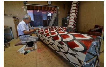
植田蛇胴製作所