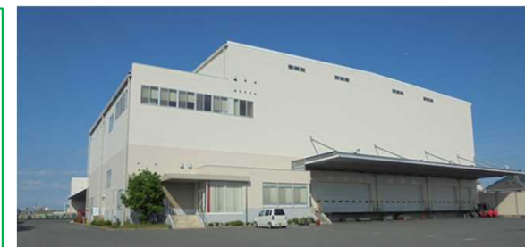
天満屋ストアグループ常温物流センター

取引先との入庫調整については引き続き実施し、営業担当者の物流への意識醸成にもつなげる