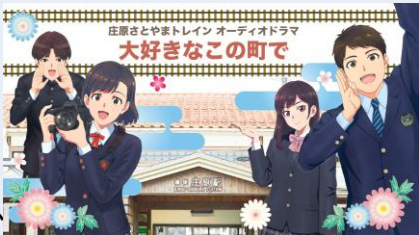
オーディオドラマ イメージイラスト

※上り：備後庄原駅 11:10発→備後落合駅 11:54着→（乗換）→備後落合駅 12:20発→東城駅 13:11着 下り：東城駅 13:37発→備後落合駅 14:26着→（乗換）→備後落合駅 14:40発→備後庄原駅 15:25着