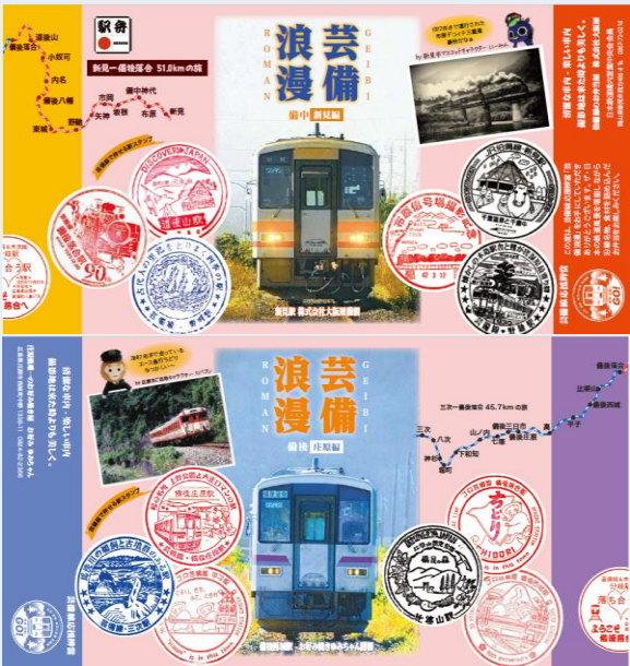
駅弁オリジナル掛け紙（新見編・庄原編）