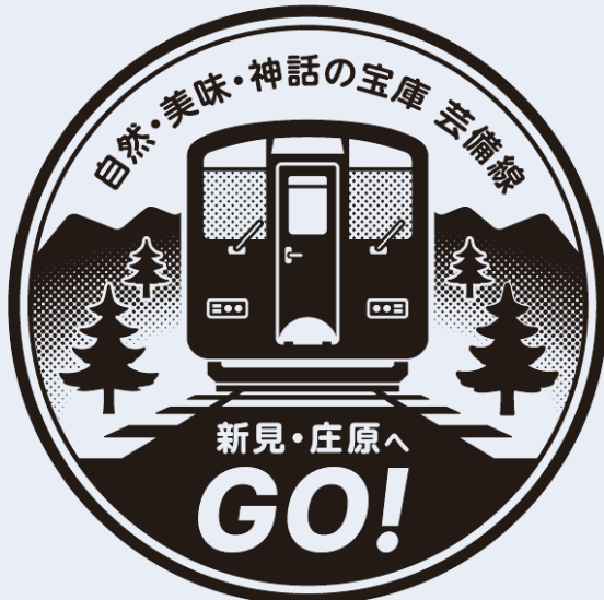
ヘッドマーク風ロゴ