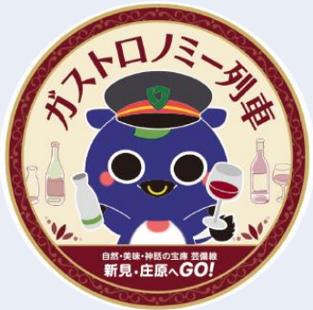
ガストロノミー列車 ヘッドマーク

※上り：備後庄原駅 11:10発→備後落合駅 11:54着→（乗換）→備後落合駅 12:20発→東城駅 13:11着 下り：東城駅 13:37発→備後落合駅 14:26着→（乗換）→備後落合駅 14:40発→備後庄原駅 15:25着