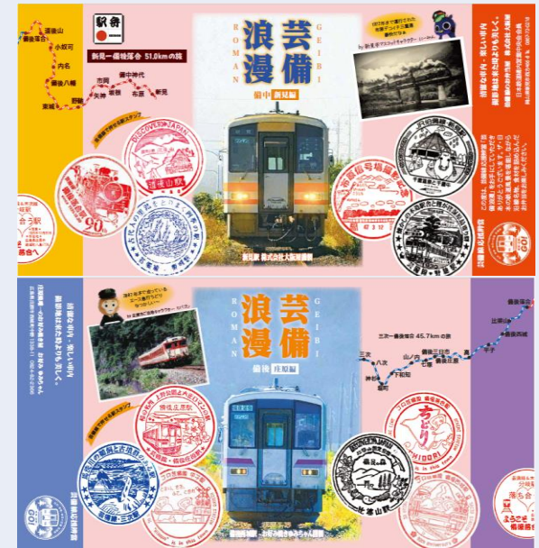
駅弁オリジナル掛け紙（新見編・庄原編）