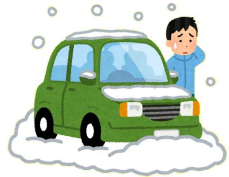
運行計画の変更は 運行管理者に指示を仰ぐ