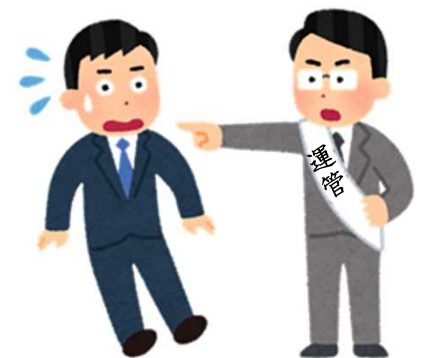
運転者へ適切な指示と 報告・連絡・相談の徹底