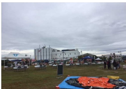
膨張式救命いかだの展張を実演しました

中国地方クルーズ振興協議会におきましては、機会を捉えて継続的にクルーズ振興に努めていきたいと考えており、中国地方各港へのクルーズ客船の更なる入港を心待ちにしています。