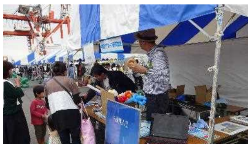
お子様が参加できるイベントとしてバルーンアートを実施し、好評でした