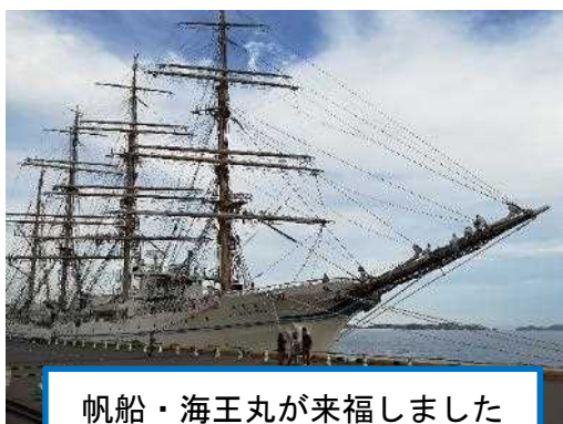
帆船・海王丸が来福しました

今年は両日もあいにくの悪天候で、両日合わせて約2.4万人と昨年に比べて2割減の来場者数となりましたが、ブースにお越しいただいた皆様の関心は高く、（一社）日本外航客船協会様、商船三井客船株式会社様、日本クルーズ客船株式会社様、郵船クルーズ株式会社様にご提供いただいたパンフレットは両日とも午後の早い時間には配り終えてしまいました。午後遅くにいらっしゃったお客様にはパンフレットをお渡しすることができず、心苦しい状況となってしまいました。