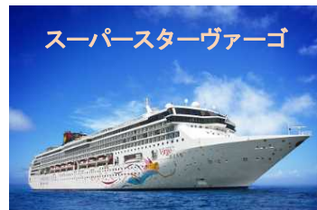
スーパースターヴァーゴ

※ セミナー終了後は17:30より、「ホテル京阪天満橋」（大阪市中央区谷町1-2-10）において「交流会」を予定しておりますので、ふるってご参加ください。