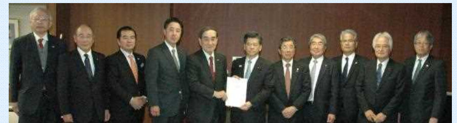
中国地方国際物流戦略チーム有志一同による政府への要望活動状況(H30.11.28)