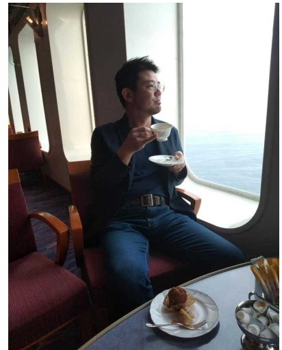
目覚めのコーヒーを一杯

この旅で驚いたのが、フィンスタビライザーの 効果でしょうか、「揺れない」ことと、フェリー のようなゴ——っという「騒音がない」こと。 洋上にいることを忘れます。これがクルーズなら ではの価値だと感じました。