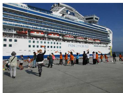
ダイヤモンド・プリンセスをお見送りする市民（釧路港）

北海道クルーズ振興協議会 事務局 国土交通省 北海道運輸局 海事振興部 鎌田・武部 札幌市中央区大通西10丁目 TEL:011-290-1011 FAX:011-290-1021