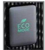
エコドライブスイッチの例

エコドライブスイッチをONにしましょう。車の制御が変わって、ゆっくり加速しやすくなり、燃費が良くなります。