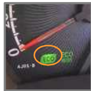
エコドライブランプの例

エコドライブランプを点灯するように運転しましょう。それがアクセルをふんわり踏んで運転することになり、燃費が良くなります。