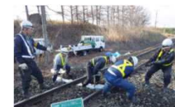
鉄道施設の設備投資や修繕

総額(2年間) 4百億円台 (額は今後確定) (1)から(3)までは全額助成、(4)は助成1/2、無利子貸付1/2