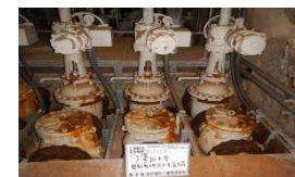
青函トンネル排水設備