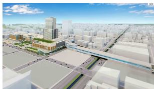
新幹線札幌駅(イメージ)