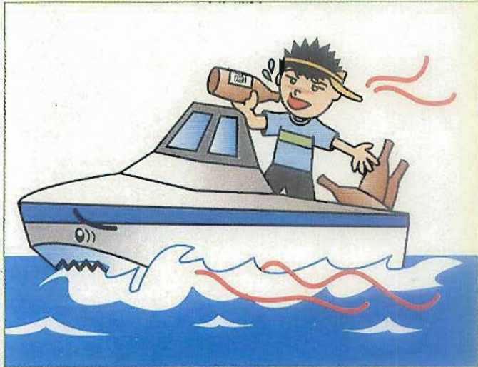
酒酔い状態等での操縦は禁止です。