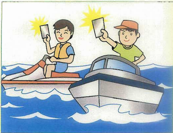
港内や航路内(水上オートバイは全ての水域)では、免許者が直接操縦しなければなりません。