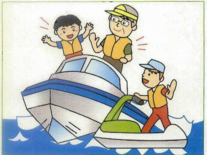
子供や水上オートバイの乗船者等は、救命胴衣(ライフジャケット)等を着用しなければなりません。