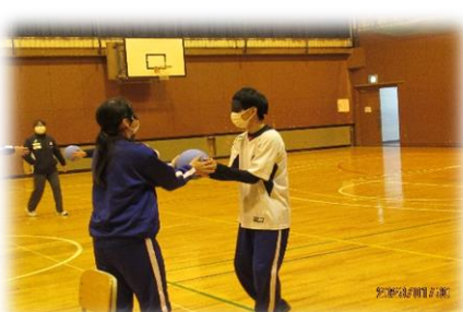
ボール回しゲーム(視覚障害体験)