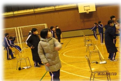
ジェスチャー伝言ゲーム(聴覚障害体験)