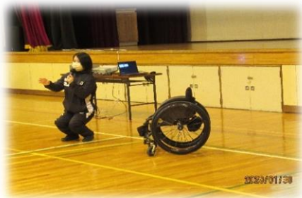
講師による障害に関する説明について説明