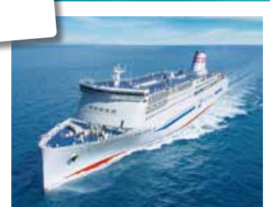
フェリー『らべんだあ』船内見学会

実施機関 / 北海道運輸局、北海道開発局小樽開発建設部、小樽市産業港湾部港湾室、小樽海上保安部、(独)国立小樽海上技術短期大学校、北海道小樽水産高等学校、(一社)日本マリン事業協会北海道地区、(一財)日本海洋レジャー安全・振興協会北海道事務所、(株)小樽ベイシティ開発、新日本海フェリー(株)、(株)マリンウェーブ小樽(小樽港マリーナ)、札幌ポート教習所協議会、小樽築港ベイエリア委員会、プリマあいこう会、浅草橋オールディーズナイト実行委員会、(公社)日本海事広報協会 協賛 / (一社)日本マリン事業協会北海道地区、西條産業(株)、新日本海フェリー(株)、(株)小樽ベイシティ開発、キロロリゾート、(一財)日本海洋レジャー安全・振興協会北海道事務所、(株)マリンウェーブ小樽、(公社)日本海事広報協会