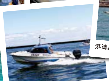
モーターボート体験操船