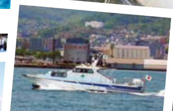
港湾業務艇「みずなぎ」体験乗船