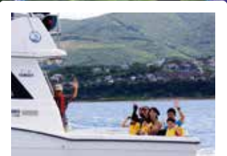
クルーザーボート体験クルーズ