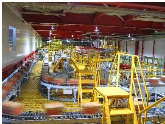
（北海道コカ・コーラボトリング 札幌工場 立体自動倉庫）

取材・撮影を希望される場合は、 19日（木）12:00まで に別添取材申込書により、下記お問合せ先までご連絡願います。