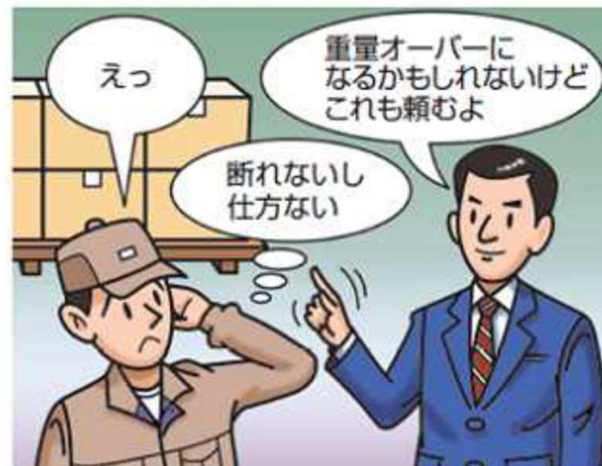
過積載になるような依頼