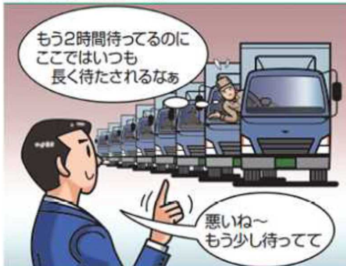
恒常的に長い荷待ち時間