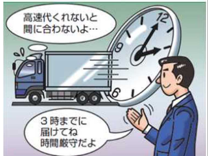
無理な到着時間の設定