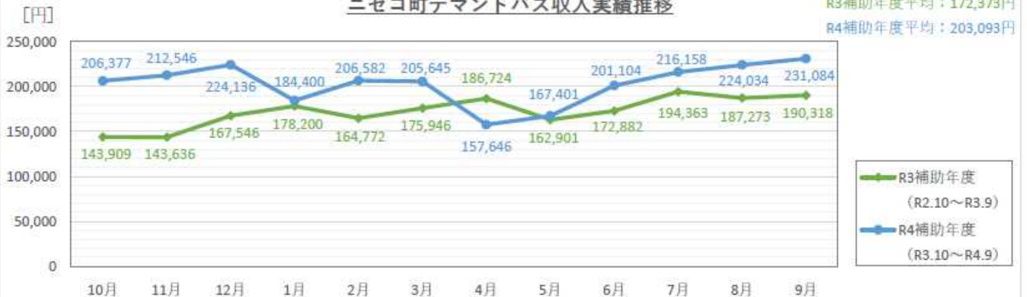
ニセコ町デマンドバス収入実績推移