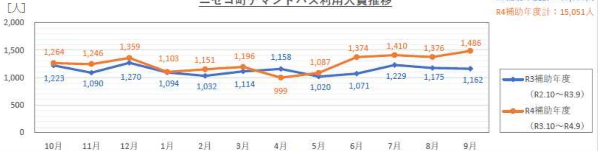
ニセコ町デマンドバス利用人員推移