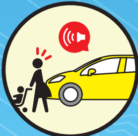
車両接近通報装置 (AVAS)