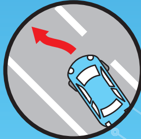
かじ取装置 (高度運転者支援ステ アリングシステム)