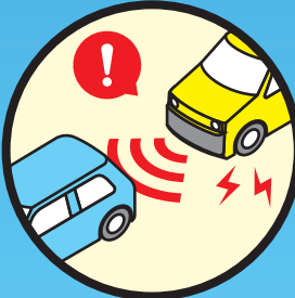
制動装置 (ABS、ESC、EVSC、 BAS、AEBS)