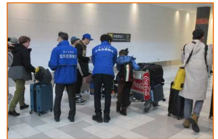
昨年度の啓発活動の様子

国土交通省北海道運輸局、北海道警察本部、札幌方面千歳警察署、千歳市、 （一社）北海道ハイヤー協会、千歳地区ハイヤー事業協同組合、カルビー株式会社