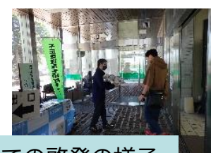
運転免許試験場での啓発の様子