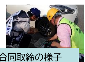
NEXCOとの合同取締の様子