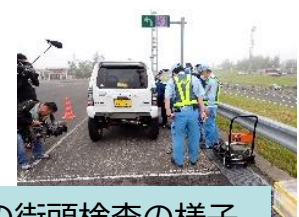
高速道路SAでの街頭検査の様子