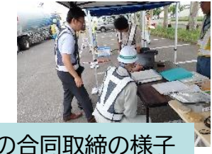
北海道開発局との合同取締の様子