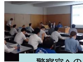
警察官への出前講座の様子