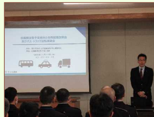
十勝地区バス協会 中木会長