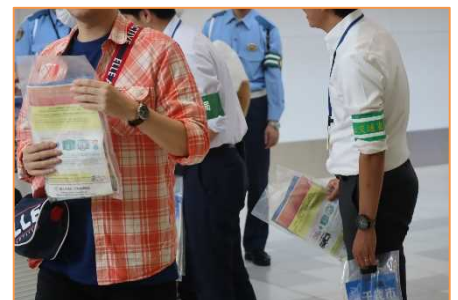
啓発チラシ配布の様子（昨年）

国土交通省北海道運輸局、千歳市、（一社）北海道ハイヤー協会、千歳地区ハイヤー事業協同組合