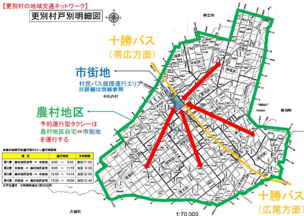
更別村戸別明細図