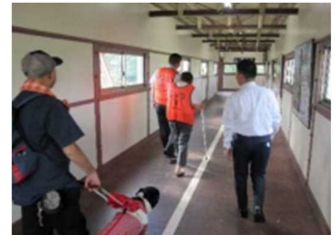
J R 遠軽駅