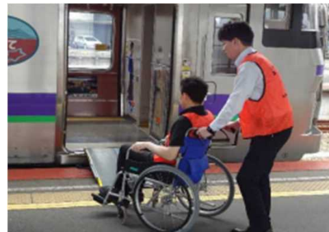
J R 函館駅