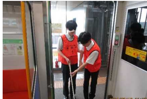
J R 旭川駅