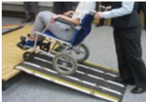
J R 北海道研修センター (札幌)